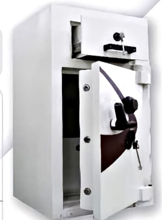
Night Drawer Trap